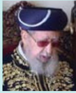
הרב עובדיה יוסף - 1920 בגדאד, עיראק - (2013 ירושלים, ישראל)

היה תלמיד חכם, פוסק ומחבר ספרי הלכה. כיהן כרב הראשי הספרדי "הראשון לציון" והיה מנהיגה הרוחני של מפלגת ש"ס מאז הקמתה. חתן פרס ישראל לספרות תורנית ופרסים רבים נוספים. נחשב בעיני רבים כבכיר הרבנים הספרדים בדורו וכונה בפי תלמידיו "מרן" ו"פוסק הדור".